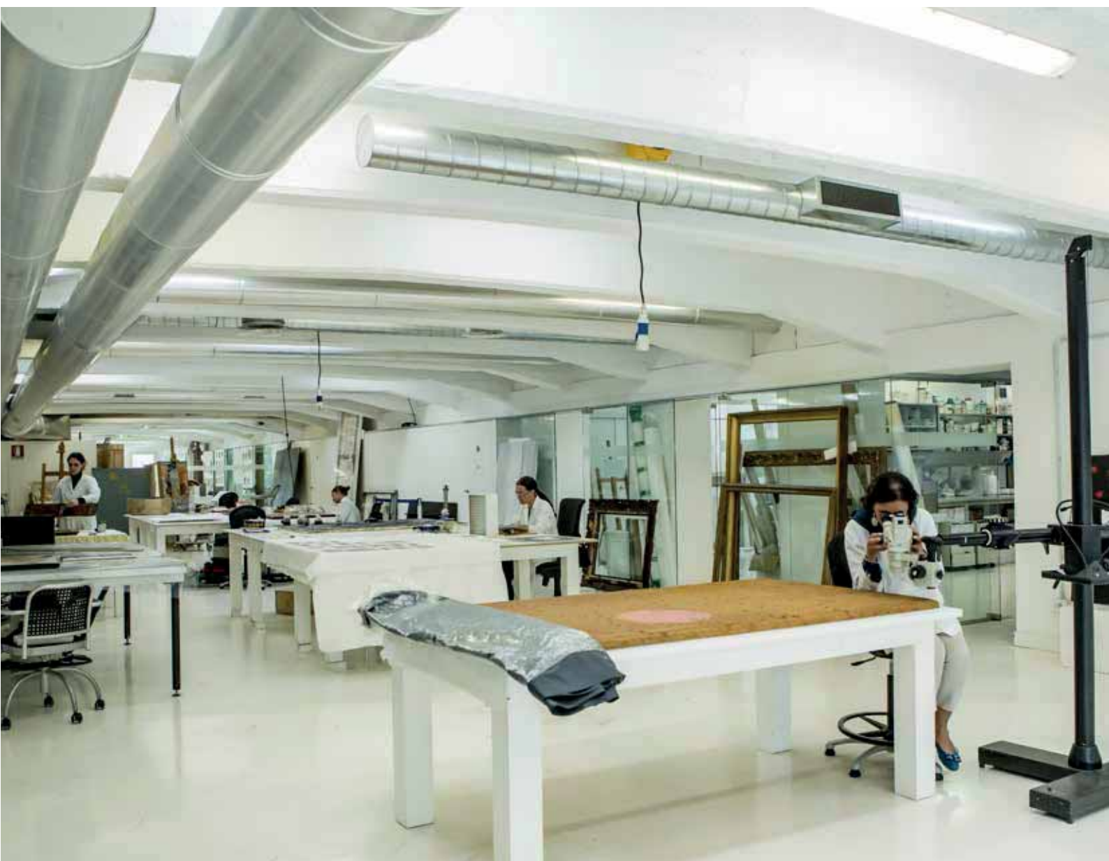
Laboratorio Dipinti e Opere Polimeriche, Open Care - Servizi per l'Arte, Milano